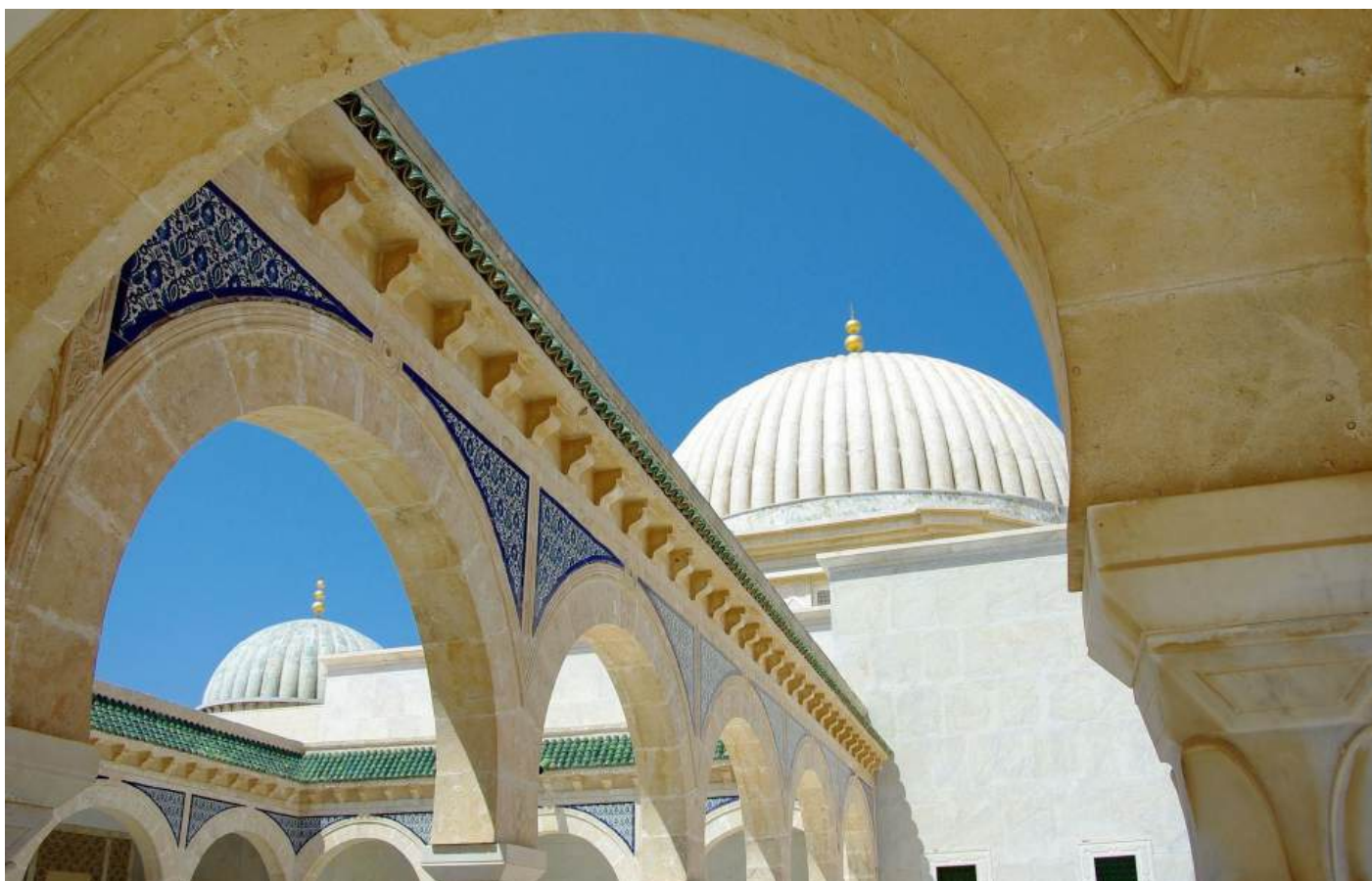
Die Bourguiba-Moschee in Monastir, Tunesien.