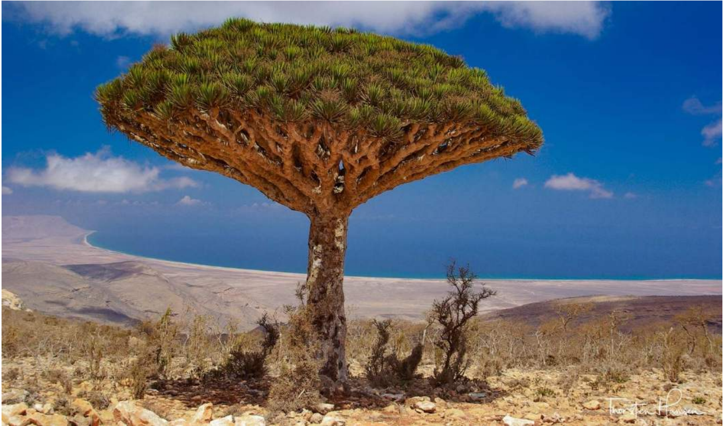
Sokotra – das „Galapagos des Indischen Ozeans“ lockt noch mit unberührter Natur vor der Küste des Jemen.